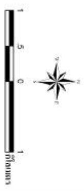
รูปที่ 3-3 แผนผังสภาพการใช้ที่ดิน ตำบลคลองใหญ่ อำเภอคลองใหญ่ จังหวัดตราด